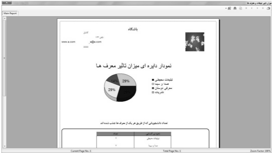
نمونه ای از یک گزارش در نرم افزار اتود

در تصویر فوق گزارش میزان تاثیر معرف ها را در نرم افزار اتود مشاهده می کنید.